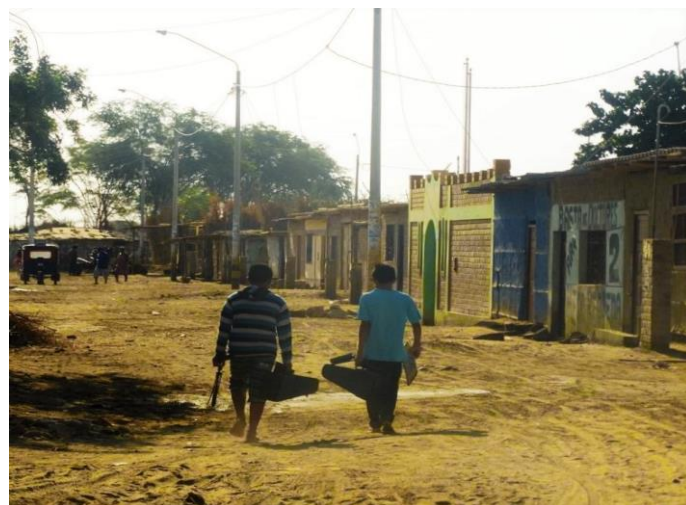
Sur le chemin de l'école